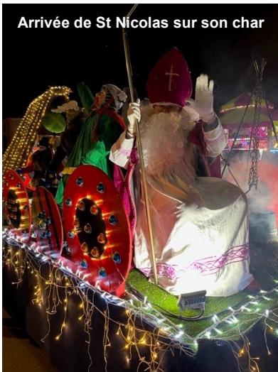
Arrivée de St Nicolas sur son char

Les festivités de Saint Nicolas ont débuté dès jeudi. Les enfants des écoles maternelle et élémentaire ont beaucoup ri aux spectacles de la compagnie les pieds dans la lune : « Qui a mangé mon gâteau au chocolat ! » et « y'a quelque chose qui clanche ! ».