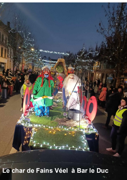
Le char de Fains Vél à Bar le Duc

Après le discours de Saint-Nicolas et le message de bienvenue du maire, le traditionnel feu d'artifice tiré au dessus de l'église a ravi le nombreux public avant la distribution des bonbons offerts par la commune et attendus avec patience par les enfants .