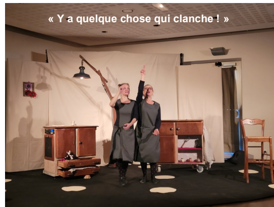
« Y a quelque chose qui clanche ! »

Vendredi soir, Saint Nicolas a défilé sur le char « Astérix et Obélix », accompagné de son acolyte le père Fouettard, l'Orchestre d'Harmonie et les jeunes sapeurs pompiers.