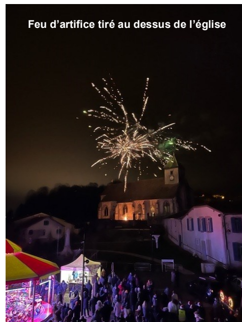
Feu d'artifice tiré au dessus de l'église

Après le discours de Saint-Nicolas et le message de bienvenue du maire, le traditionnel feu d'artifice tiré au dessus de l'église a ravi le nombreux public avant la distribution des bonbons offerts par la commune et attendus avec patience par les enfants .