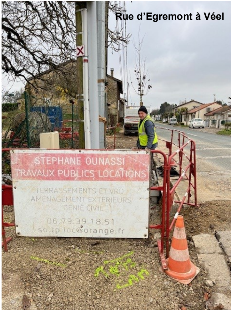
Rue d'Egremont à Véel

La 2ème tranche d'enfouissement des réseaux secs rue d'Egremont à Véel confiée à l'entreprise SO-TP-LOC se terminent.