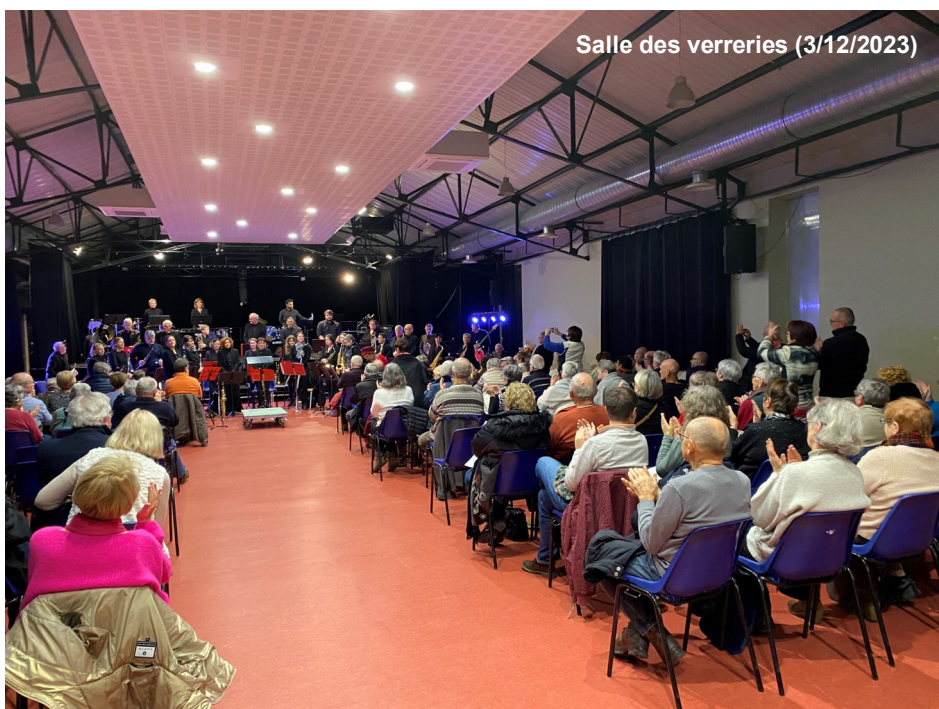
Salle des verreries (3/12/2023)

L'orchestre se produira samedi 13 janvier à 20h30 à Beurey/Saulx, dimanche 14 janvier à 15h00, salle Léo Lagrange de Revigny/Ornain, et dimanche 21 janvier à Naives-Rosières à 15h30.