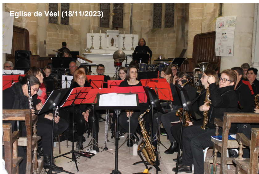
Eglise de Véel (18/11/2023)

Comme traditionnellement le samedi de la fête patronale à Véel, l'orchestre d'harmonie a répété ses gammes en l'église Saint Martin de Véel.